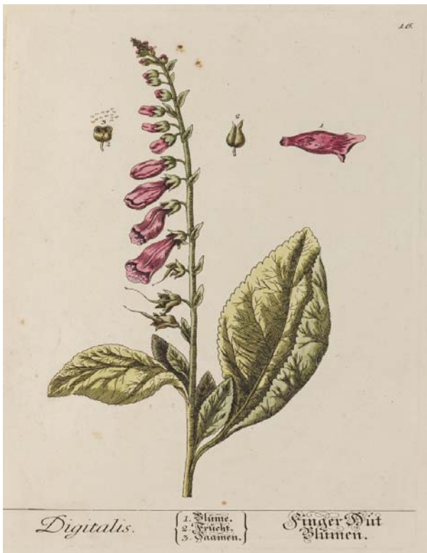
[ Digitalis purpurea ; Elisabeth Blackwell, Herbarium Blackwellianum, Norimbergae, 1750]

Le lezioni offerte agli studenti della Scuola Superiore prevedono una breve parte teorica (frontale) allo scopo di fornire una descrizione dell'argomento trattato, ma saranno prevalentemente incentrate su esperimenti che li coinvolgeranno direttamente al fine di comprendere la ricerca nell'ambito della farmacognosia, fitoterapia, farmacologia. La parte sperimentale, in cui è previsto il coinvolgimento degli studenti, prevede il riconoscimento attraverso diverse metodiche di alcune droghe vegetali e la preparazione di estratti. Verranno ad esempio preparati oli essenziali mediante distillazione in corrente di vapore ed estratti vegetali mediante macerazione. Degli estratti ottenuti verrà effettuata l'analisi fitochimica.